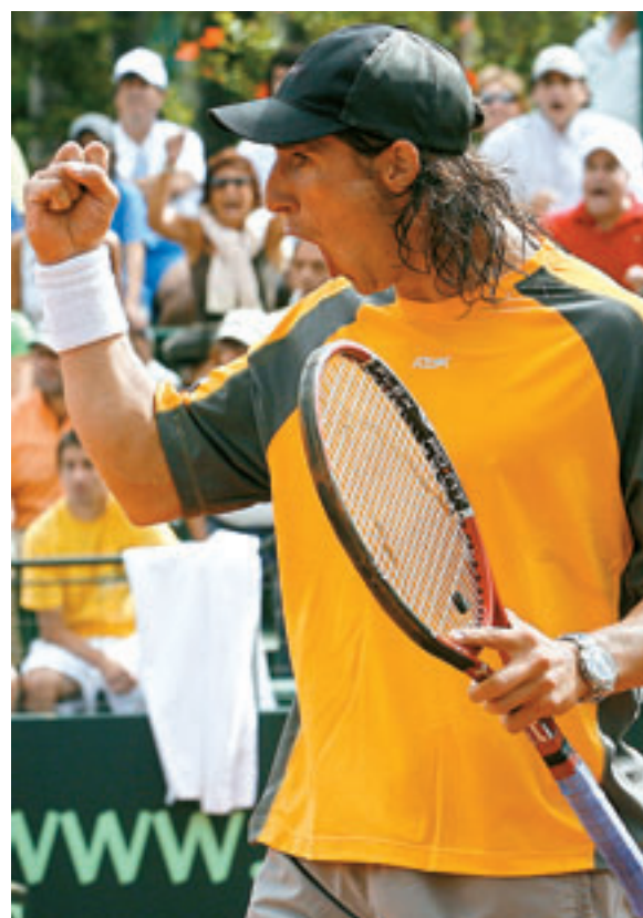
HA MEJORADO. Cuevas pasó de hoteles pequeños a más importantes ahora

que esto debía cambiar, porque mal dormido y sin descansar era imposible jugar bien al tenis", afirmó.